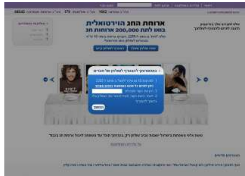
שלב 3 : הזן את הקוד באתר