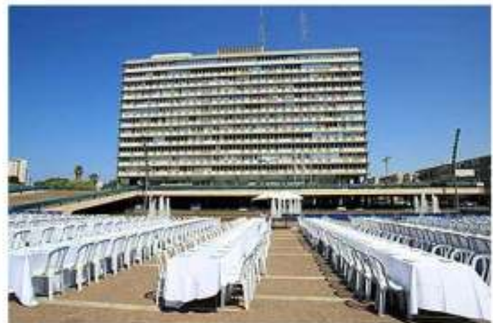
כיכר רבין בתל-אביב הפכה אתמול לחדר אוכל ענקי. מאות רבות של שולחנות ארוכים מכוסים במפות לבנות, אלפי כסאות פלסטיק, צלחות וסכו"ם. רק דבר אחד חסר במיצג הייחודי, שגרם לרבים לעשר ולהסתכל בסקרנות, - אוכל.

המיצג יוצא הדופן, שיישאר בכיכר עד יום א' הקרב, הוא למעשה יריית הפתיחה של קמפיין ביזמת ארגון "ynet", בשיתוף ידיעות אחרונות וכתמיכת "הארץ". שולחנות ארוכים מכוסים במפות לבנות, אלפי כסאות פלסטיק, צלחות וסכו"ם ריקים כיסו את כיכר רבין בשאיפה לגייס 200 אלף ארוחות חג, למשפחות נזקקות. "מדינת ישראל מסירה אחריות מזה שנים רבות ומתכחשת לחובתה הבסיסית לדאוג לביטחון תזונתי לאזרחיה"