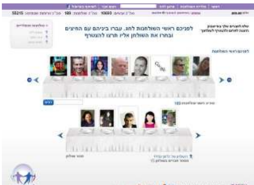
שלב 4 : בחר את השולחן אליו תרצה להצטרף